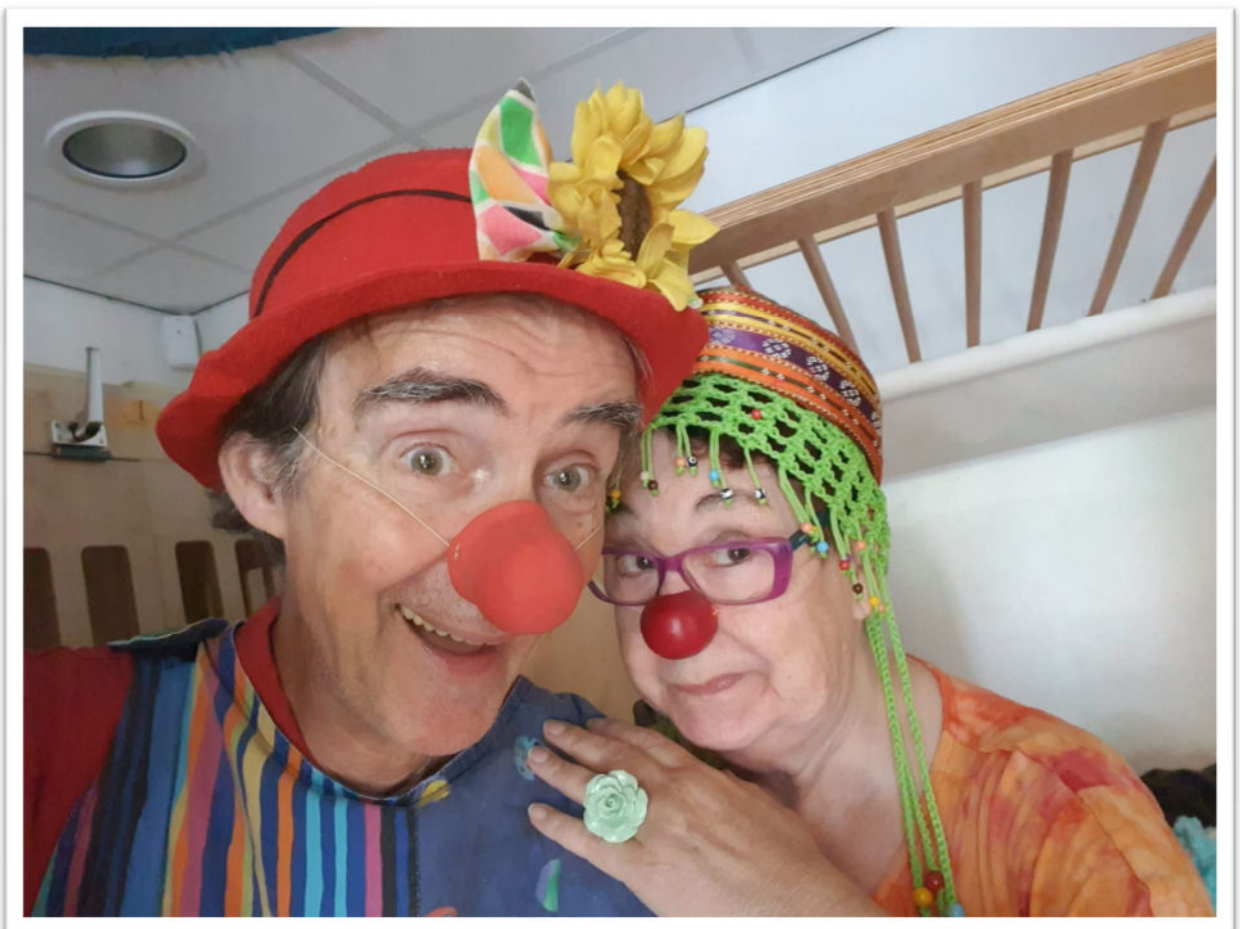
Tut en Flops bij ZigZag Zaandam

Het was een mooie middag met een hartelijk ontvangst en we mogen weer komen!