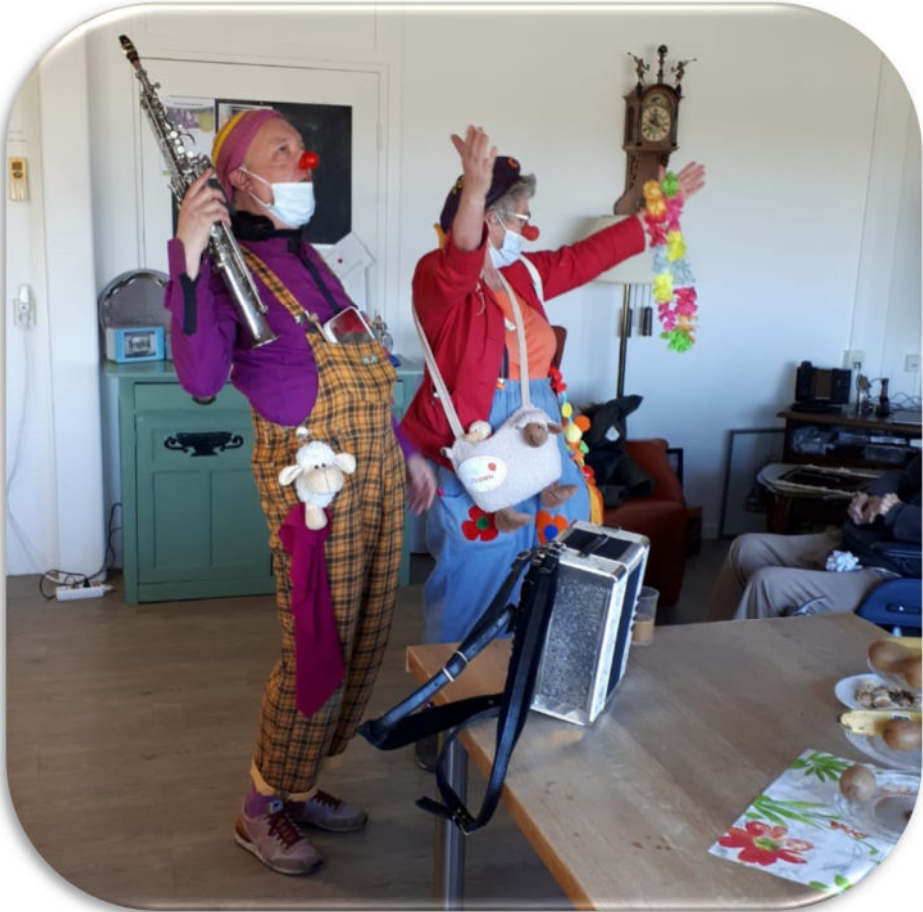
Of dansend bij de Talma Hof te Emmeloord: